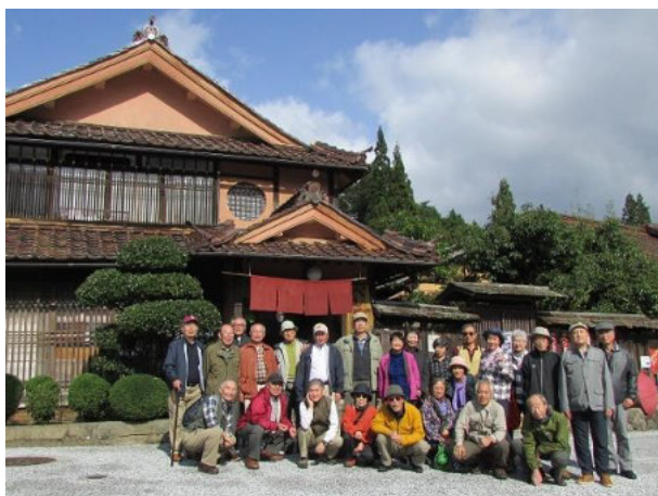
全員集合写真（吹屋）