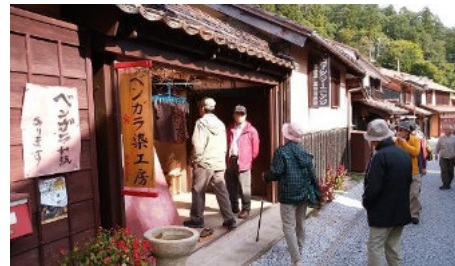
吹屋町並 & ポスト

ベンガラは黄銅鉱とともに産出さ れる酸化鉄鋼をから作られる副産物 で建物の格子・塀に塗布、赤瓦とと もに町全体がベンガラ色に染めら れ、古き時代へタイムスリップさ せてくれました。