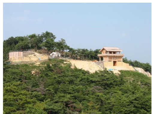
鬼ノ城 西門(パツより)