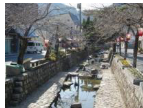
紺屋川筋美観地区

また、歩いた街道筋の一部が松竹映画「男はつらいよ」のロケ地になったそうで、”寅さん”の気分も味わえた、2時間足らずの散策でした。