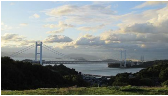
瀬戸大橋 ホテルから

宿は瀬戸大橋を眼前の鷲羽山です。単純弱放射能泉でゆったりし、ハロウィンさながらの被りものでカラオケ宴会。大いに語り・唄い・笑いました。