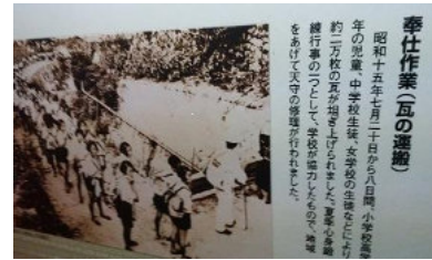
奉仕作業（瓦の運搬）

松山城を後にし、銅とベンガラ のまち「吹屋」に移動、昼食は元中 学校舎のレストランで、柔らかくて 旨い新見地鶏をいただきました。