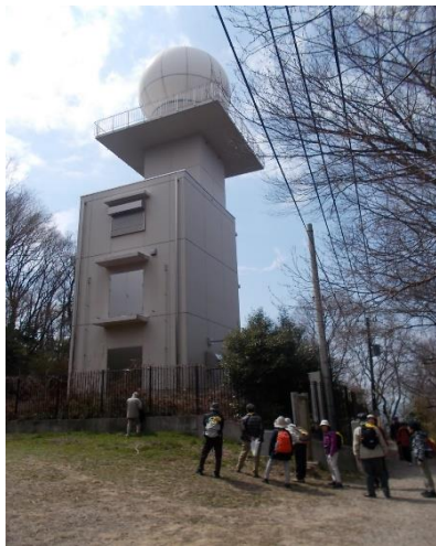
高安山気象レーダー観測所

さらに生駒山地の南端となる標高437mの信貴山には、大阪からは見えないが、国宝「信貴山縁起絵巻」で知られる信貴山朝護孫子寺があります。朝護孫子寺は廃仏派の物部守屋討伐に向かう聖徳太子が、寅の歳、寅の日、寅の刻に、山上で毘沙門天を感得し、勝利を得たことから、この地に毘沙門天さまをお祀りしたことが縁起とされ、参道には大きな張子の虎が迎えてくれます。