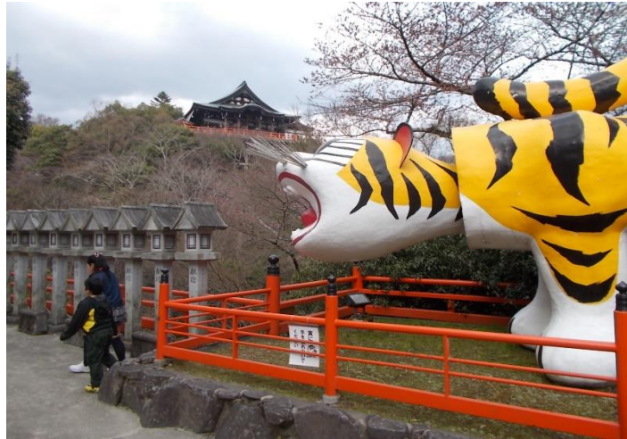
信貴山朝護孫子寺