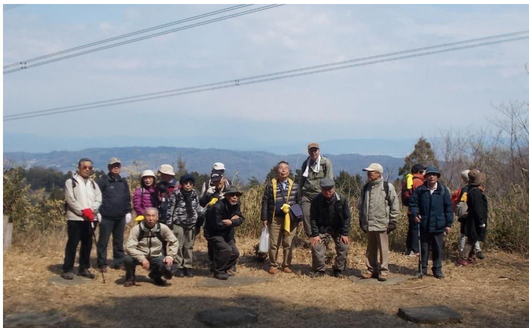
倉庫群跡から平群方面

ハイキング道は時に急坂があるが、落ち葉が踏みしめられた、なだらかな道が続き、不順だった天候も吹き払われ心地よい山歩きとなりました。桜はたわわにつぼみが膨らみ、灌木の梢には極小さい薄緑の新芽が顔を出し、もみじは赤ちゃんの握りこぶしを今開かんとばかり、鶯はレッスン中だろうか、たよりなくケキョ・ケキョと鳴くだけ、森の中では、木々も鳥も春の息吹を精一杯感じていました。私たち人間もでしたね。