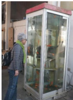
金魚の泳ぐ電話ボックス。勿論通話は出来ません。